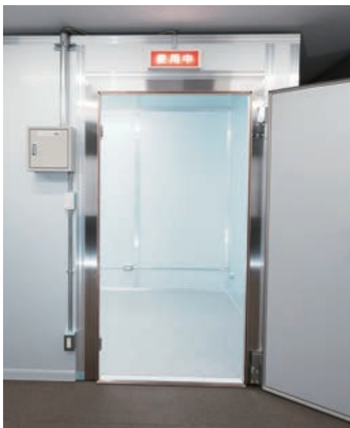
ナイフエッジタイプシールド扉（低段差仕様）