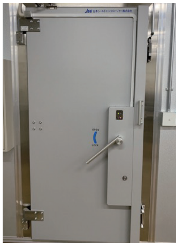
セキュリティ仕様（鍵付き・RFID）

※手動扉は、開閉動作容易（軽い）です。低段差仕様のため機器搬入がスムーズに行えます。